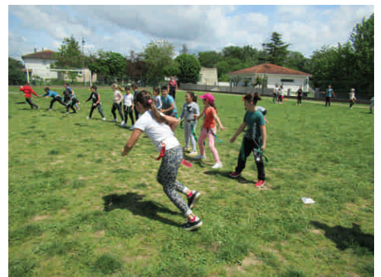
Football américain avec le club Hurricane d'Albi