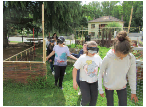
Atelier handisport : parcours pour des non-voyants guidés par leurs camarades