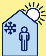
RESTEZ AU FRAIS