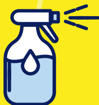
Mouillez-vous le corps