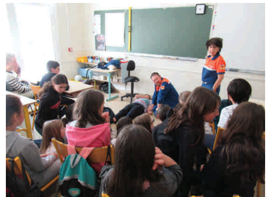
Premiers secours avec les bénévoles de la protection civile