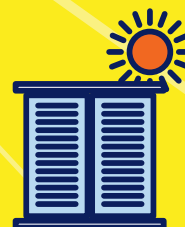
Fermez les volets et fenêtres le jour, aérez la nuit