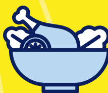
Mangez en quantité suffisante