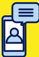
Donnez et prenez des nouvelles de vos proches