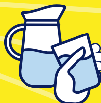
BUVEZ DE L'EAU