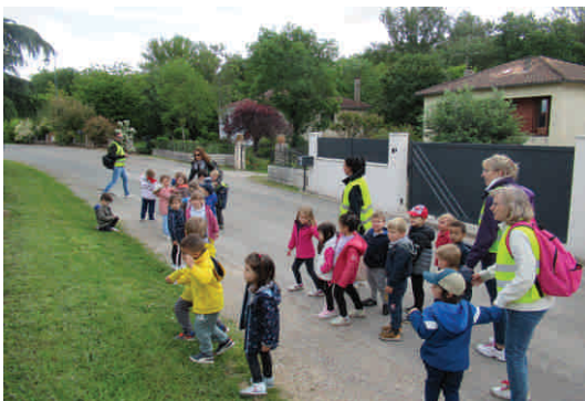
Retour de randonnée pour une classe de maternelle