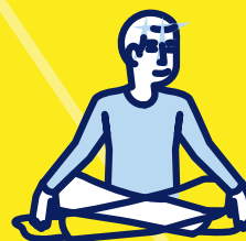
Préférez des activités sans efforts